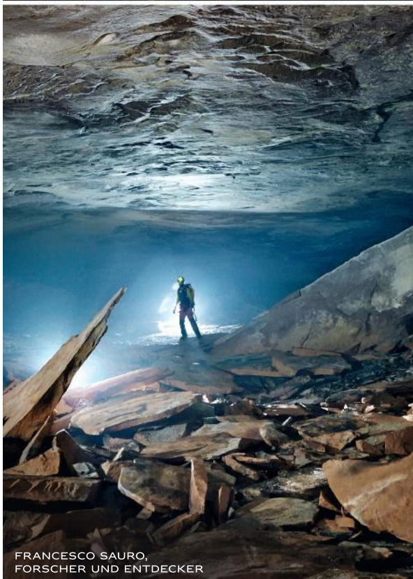
FRANCESCO SAURO, FORSCHER UND ENTDECKER