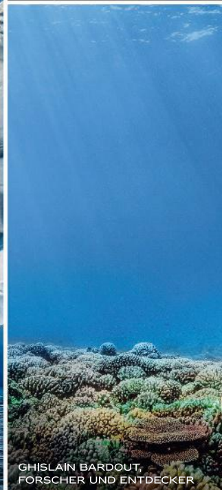
GHISLAIN BARDOUT, FORSCHER UND ENTDECKER