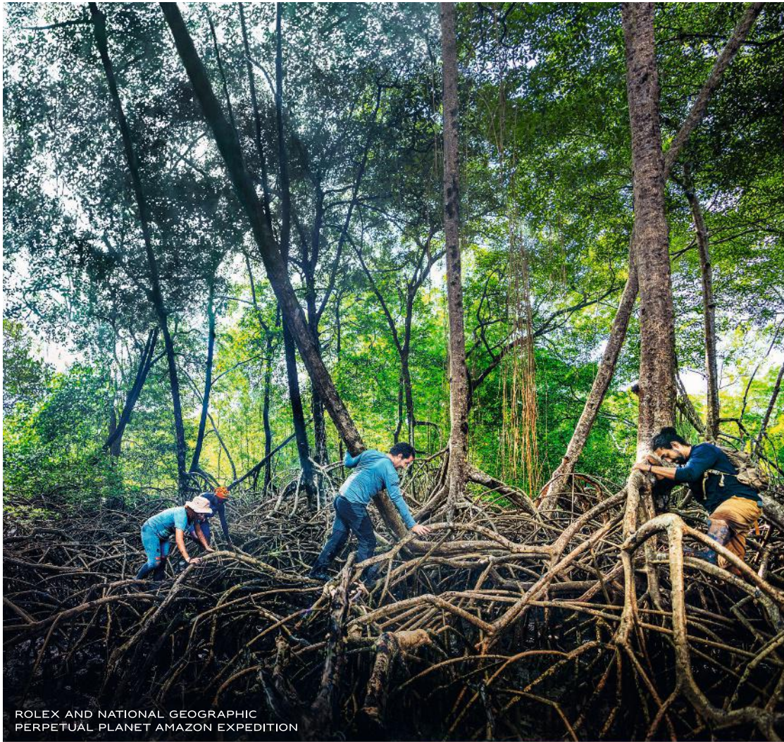
ROLEX AND NATIONAL GEOGRAPHIC PERPETUAL PLANET AMAZON EXPEDITION