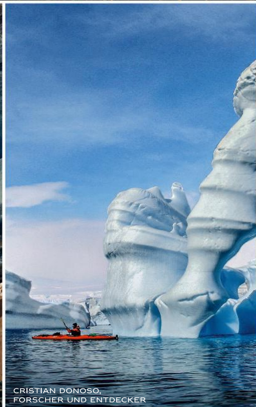
CRISTIAN DONOSO, FORSCHER UND ENTDECKER