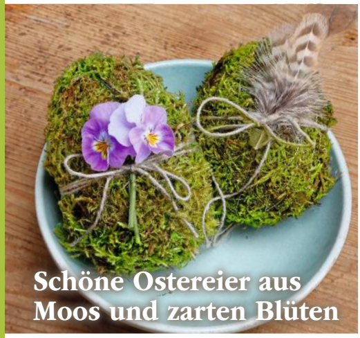
Schöne Ostereier aus Moos und zarten Blüten