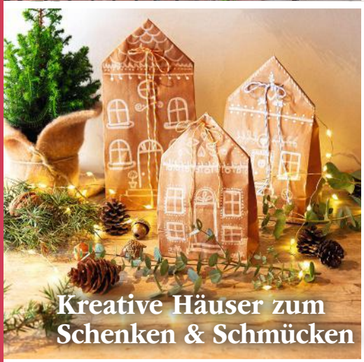
Kreative Häuser zum Schenken & Schmücken