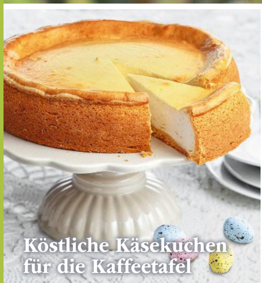
Köstliche Käsekuchen für die Kaffeetafel

AT 6 € • CH 8,30 sfr • BeNeLux 6,20 € • FR, IT, ES, PTcont 7,30 €