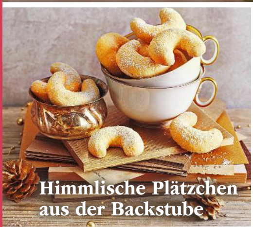
Himmlische Plätzchen aus der Backstube

AT 6 € • CH 8,30 sfr • BeNeLux 6,20 € • FR, IT, ES, PT cont 7,30 €