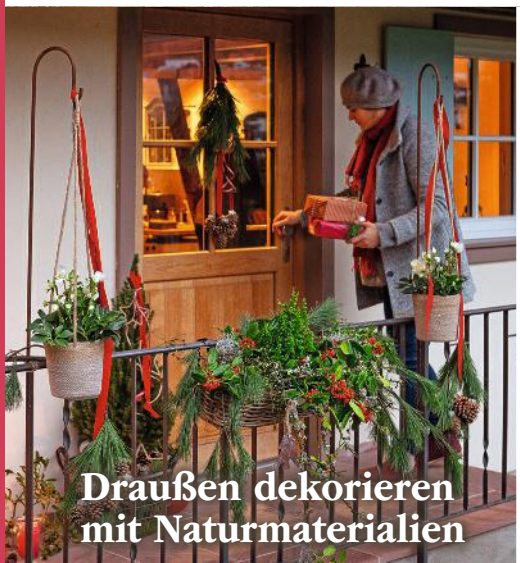
Draußen dekorieren mit Naturmaterialien