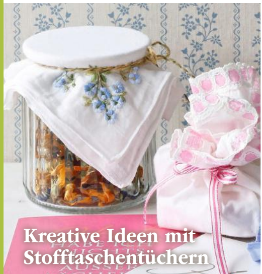
Kreative Ideen mit Stofftaschentüchern