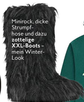
Minirock, dicke Strumpfhose und dazu zottelige XXL-Boots – mein Winter-Look