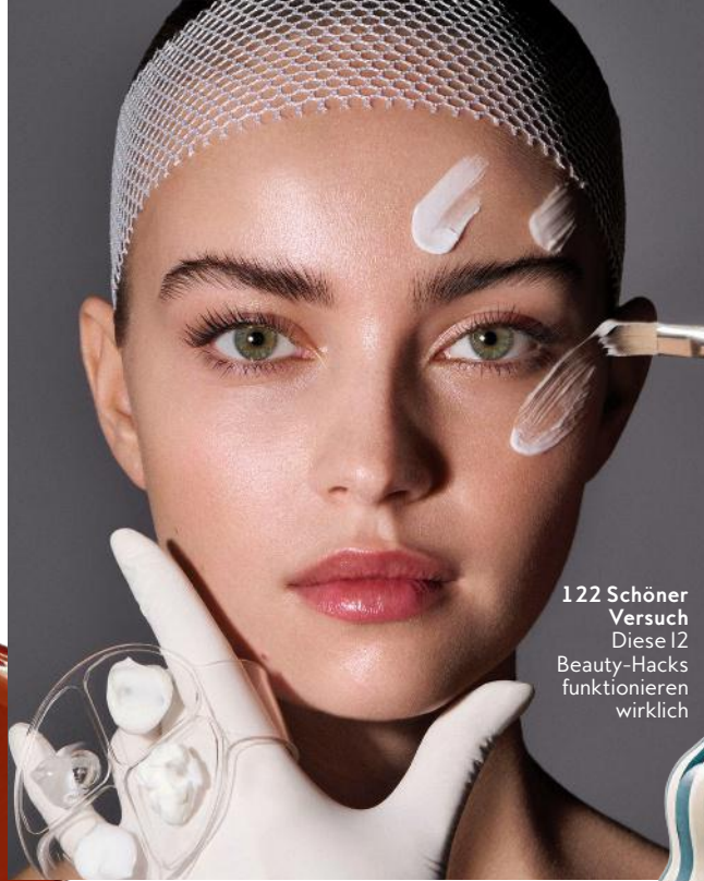
122 Schöner Versuch Diese 12 Beauty-Hacks funktionieren wirklich