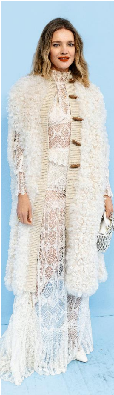
Model Natalia Vodianova trägt einen Full Look aus Shearling und Ajourstrick, von Dior