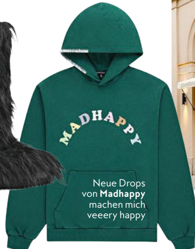
Neue Drops von Madhappy machen mich veeery happy