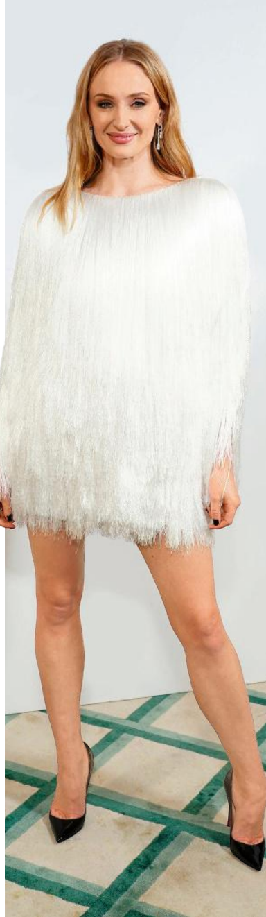
Schauspielerin Sophie Turner („Joan“) in einem Fransenkleid von Louis Vuitton