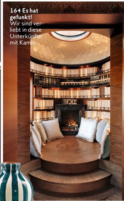
164 Es hat gefunkt! Wir sind verliebt in diese Unterkünfte mit Kamin