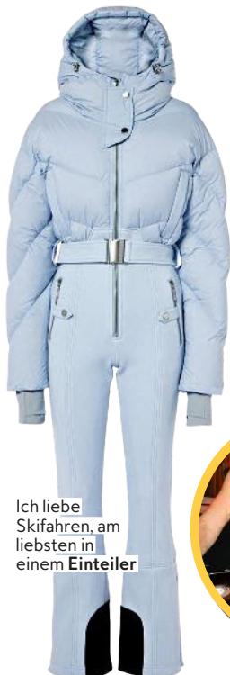
Ich liebe Skifahren, am liebsten in einem Einteiler