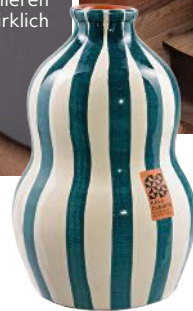
144 Happy Vibes Living-Pieces, die Musikproduzent Benny Blanco gefallen würden – für Ihr Zuhause