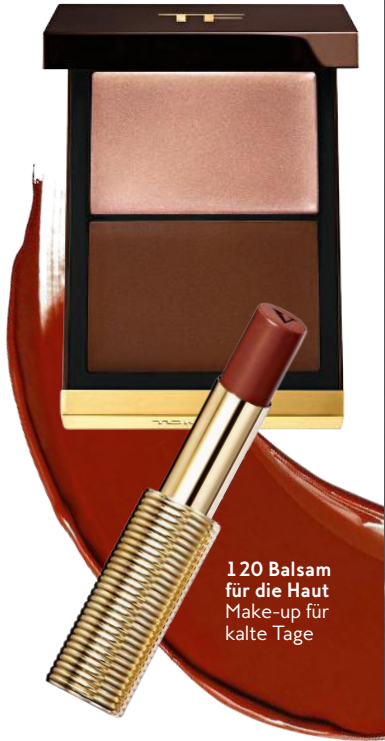
120 Balsam für die Haut Make-up für kalte Tage